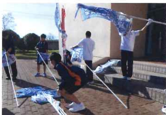
来年の大会開催に期待をのぼりを回収