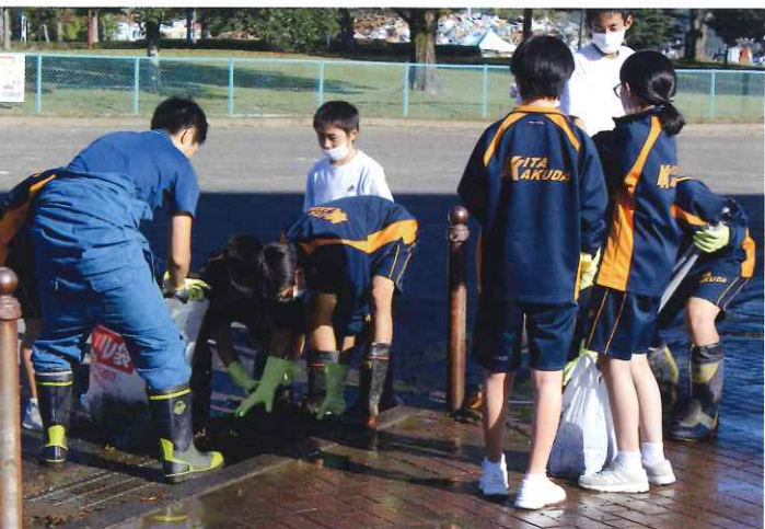
協力し合いながら側溝の泥や落ち葉の除去

各施設の利用再開に向け復旧作業が進む中、10月28日に北角田中学校の生徒たちが「地域貢献活動」として、総合体育館正面エリアの清掃や堆積した泥を除去する「スポーツボランティア」を行いました。また当日は、11月3日に開催予定だった阿武隈リバーサイドマラソン大会が中止になったため、通知の発送準備やのぼりを回収する作業も行い、スポーツに関わるボランティア活動の一日となりました。