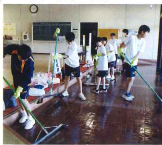
玄関の泥もていねいにかき出しました

各施設の利用再開に向け復旧作業が進む中、10月28日に北角田中学校の生徒たちが「地域貢献活動」として、総合体育館正面エリアの清掃や堆積した泥を除去する「スポーツボランティア」を行いました。また当日は、11月3日に開催予定だった阿武隈リバーサイドマラソン大会が中止になったため、通知の発送準備やのぼりを回収する作業も行い、スポーツに関わるボランティア活動の一日となりました。