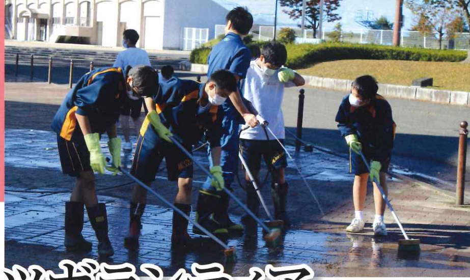
施設の利用再開に向け清掃作業に取り組む北角中生