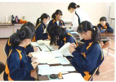
大会中止の通知を発送する準備

僕は総合体育館の奉仕作業で2つの活動をしました。まず、はじめはリバーサイドマラソン大会ののぼりの片付けをしました。とてもきれいにできました。次に台風で風で落ちた葉の片付けをしました。台風がくる前のようにきれいになりました。来年はリバーサイドマラソン大会が開催できるようにしたいです。これからも総合体育館を大切にしていきたいです。