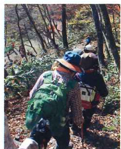
落葉を踏みしめてコースを進む参加者

問い合わせ先 公益財団法人 角田市地域振興公社(総合体育館内) TEL.0224-63-3771