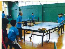
基礎から楽しく指導を受ける卓球教室

毎月第2、第4土曜日の10時から角田市自治センターで開催しているジュニア卓球教室。初心者を対象に角田市卓球協会のコーチが優しく指導しています。連続的にボールが打ち出される「卓球マシン」でさらにプレーが楽しめます。※ラケットはクラブで準備しています。