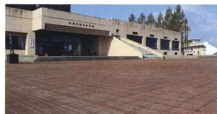
きれいに片付いた体育館正面エリア